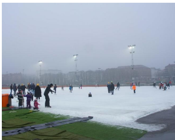
剛好遇到溜冰不用錢的一天！

語言部份，很少會遇到不會說英文的瑞典人（包含小孩和老人），倒是會遇到英文沒那麼好的交換學生。所以只要英文不要太差（至少有辦法問路人店員問題並且聽得懂），瑞典會是很適合你的地方。三餐的話，在瑞典外食是非常昂貴的，隨便一餐就需要台幣兩三百塊（在台灣可能不需要一百元），如果願意下廚，可以為你省下飲食方面的很多費用；反之，若你不想要下廚，其實很不方便，而且會給你很大的經濟負擔。